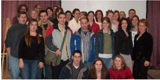
De nombreux élèves étaient présents... la relève de demain c'est important